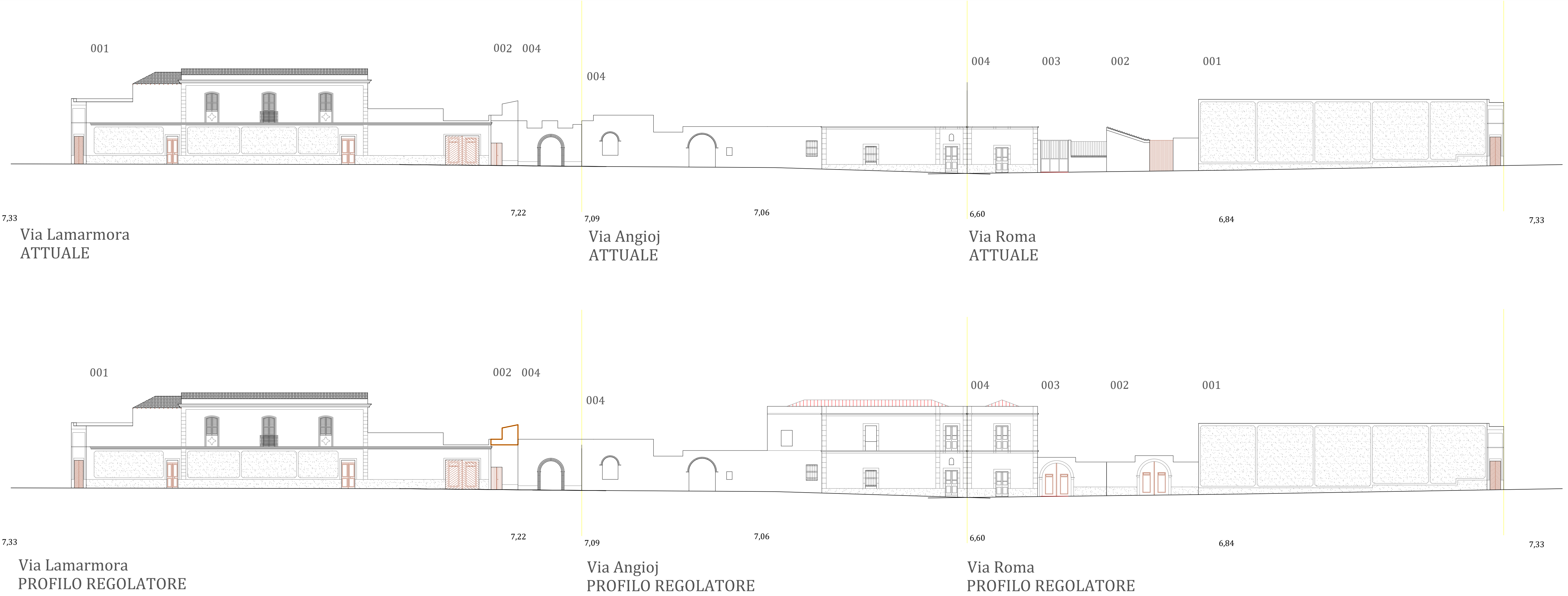
Profili stradali: stato attuale (sopra) e prescrizioni progettuali (sotto) (scala 1:200)